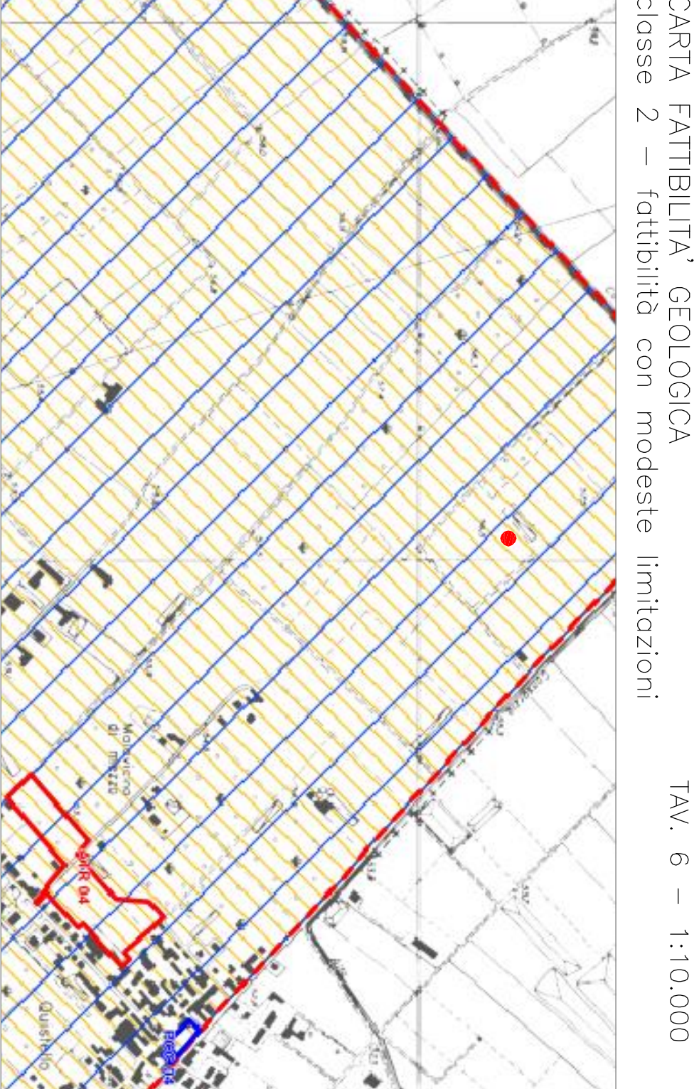
ESTRATTO DI P.G.T. — Piano delle regole Insediamenti produttivi connessi all'attività agricola in contesto agricolo